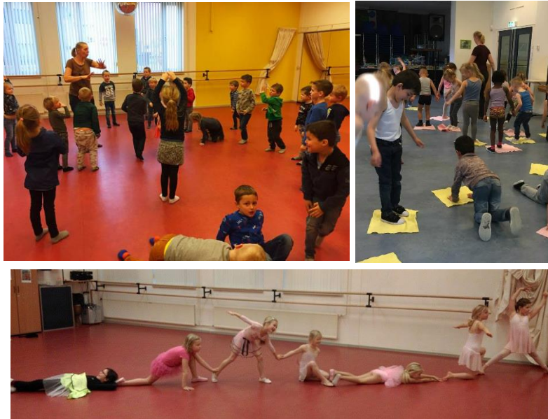
De voorjaarsschoonmaak tijdens de lente-dansles van het OKVO-Plusmenu.