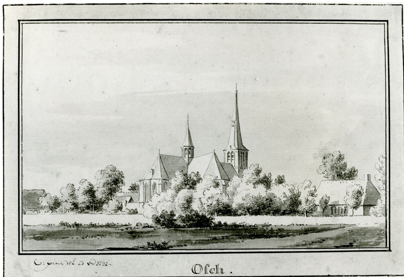
Een tekening van de kerk in Oss zoals die er tijdens de middeleeuwen zal hebben uitgezien.